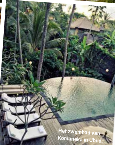
Het zwembad van Komaneka in Ubud.

Soms wil je even helemaal weg: weg van het drukke leven, waarin je zo veel moet. Weg van de files en de dagelijkse ratrace vol afspraken en verplichtingen. Het liefst zo ver mogelijk hiervandaan: tijd voor een trip naar Bali. Op dit relax-, wellness- en yogaeiland hoef je namelijk niets anders te doen dan je lekker ontspannen. De Balinezen zijn heel gastvrij en dat is precies de kracht van deze vakantiebestemming: Bali is voor iedereen.