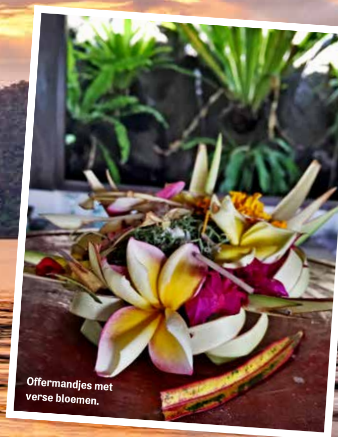
Offermantjes met verse bloemen.

De beroemde hindoeïstische tempel van Pura Ulun Danu Bratan.