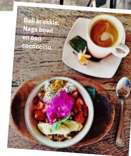
Bali brekkie: Naga bowl en een cococcino.