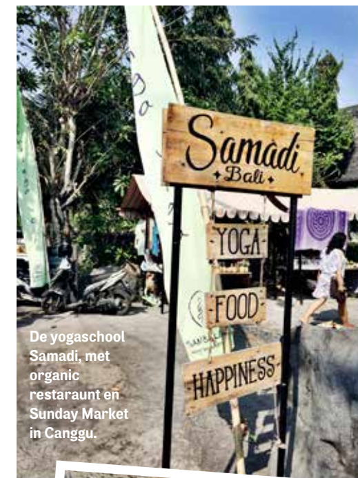
De yogaschool Samadi, met organic restaurant en Sunday Market in Canggu.

Zorg voor ruimte in je koffer, want er moeten gehied wat nieuwe aankopen mee terug naar Nederland. De leukste winkelstraten zijn Jalan Laksmana, Jalan Petitenget en Jalan Raya Seminyak. Daar vind je voornamelijk veel kleding- en sieradenwinkels. Voor mooie meubels, koloniale kunst en interieuraccessoires kun je het best naar Jalan Kerobokan.